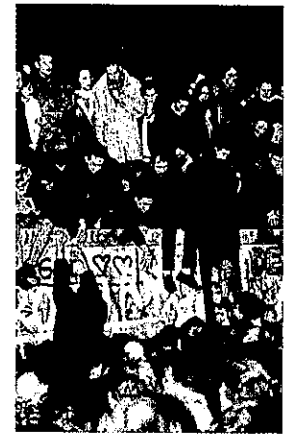
Die Mauer ist gefallen.